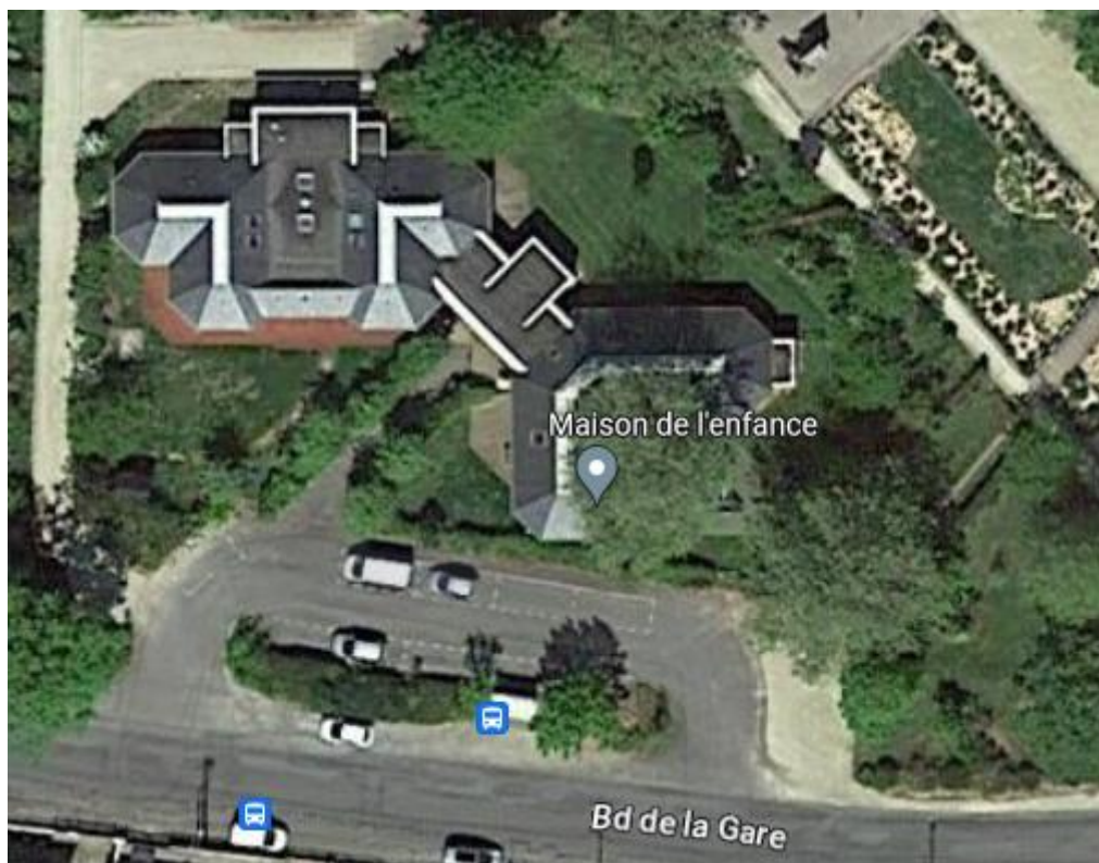
MAISON DE L'ENFANCE PPMS RISQUES MAJEURS